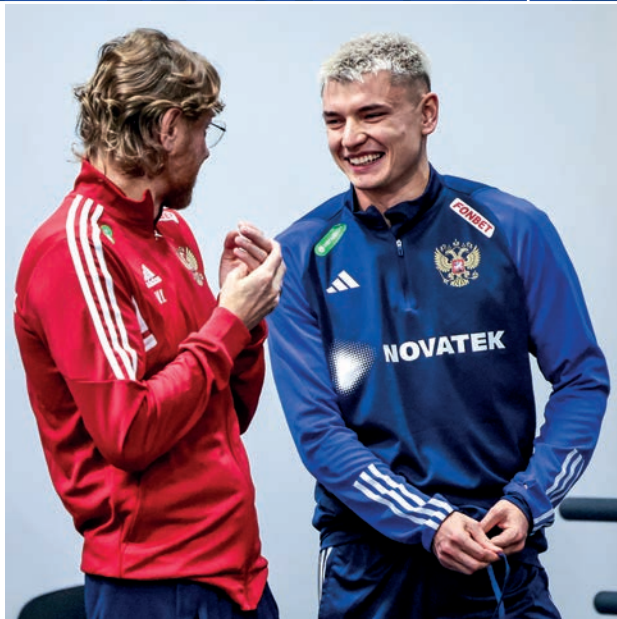
13.11.2023. УТЦ «Новогорск». Валерий Карпин (слева) и Андрей Мостовой в преддверии матча с Кубой в отличном настроении.