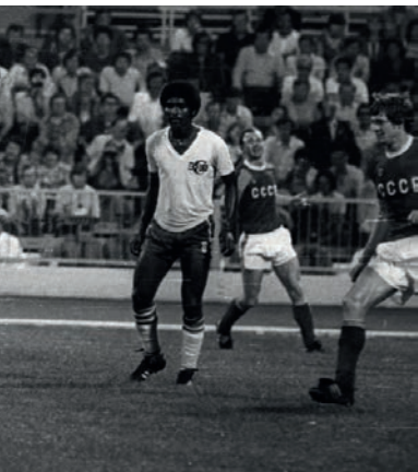
24.07.1980. Москва, стадион «Динамо». В атаке полузащитник Юрий Гаврилов (с мячом).

Но, знаете, я бы без вопросов поменял тот хет-трик на хотя бы один гол в ворота сборной ГДР в полуфинале, где с нами произошла катастрофа. Кто сейчас вспомнит тот разгром Кубы! А вот то, что