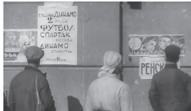
Афиша была единственной на весь Сталинград: вешать объявления оказалось не на что. Зато анонс был написан фиолетовыми чернилами на ослепительно белой, непривычной по военным временам бумаге.

Но как пойдёт игра? Испытывали чувство страшной ответственности. Будто всю жизнь гоняли мяч ради этого дня. Что ж, есть старая, за давностью лет забытая поговорка: «Кто не переживает, тот не играет». Поверялись: «Если уступим, то с честью. Биться до финального свистка».