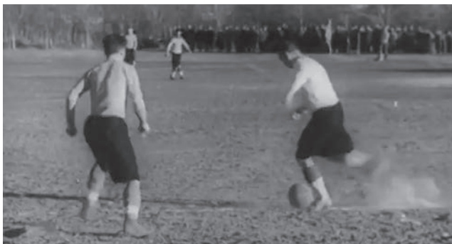
02.05.1943. Сталинград. Стадион «Азот». Эпизод «Матча на руинах Сталинграда». С мячом футболист «Динамо». Ещё за несколько дней до игры на месте футбольного сражения размещались тяжёлые дальнебойные зенитки. Динамовские спортсмены самостоятельно приводили в порядок поле (закапывали оставшиеся глубокие ямы) и ремонтировали трибуны.