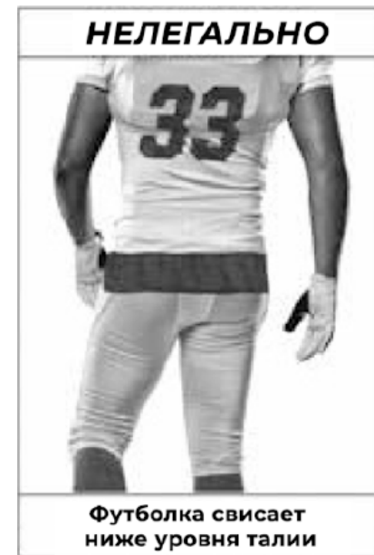
Из Приложения Е