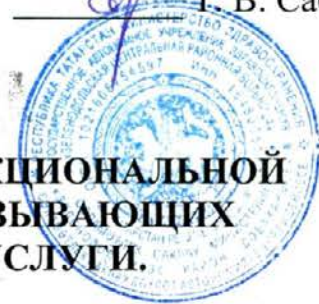
ГРАФИК РАБОТЫ МЕД. ПЕРСОНАЛА ОТДЕЛЕНИЯ ФУНКЦИОНАЛЬНОЙ ДИАГНОСТИКИ (СТАЦИОНАР), ОКАЗЫВАЮЩИХ ПЛАТНЫЕ МЕДИЦИНСКИЕ УСЛУГИ.