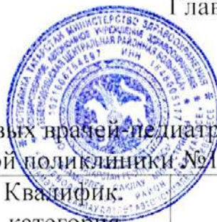
График приёма участковых врачей-педиатров ГАУЗ ЗЦРБ детской поликлиники №1