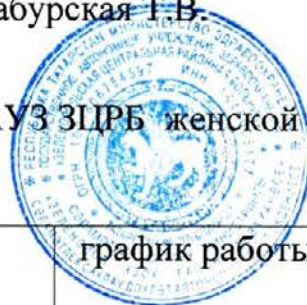
График работы врачей, оказывающих платные услуги в ГАУЗ ЗЦРБ женской консультации